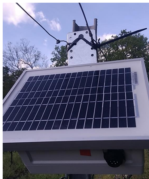
Fixation avec colliers de serrage