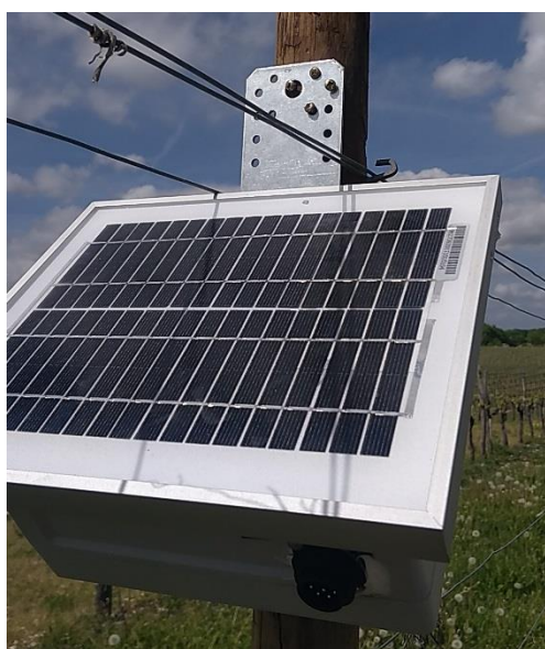
Fixation avec vis à bois